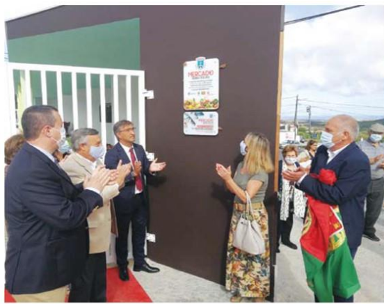
Momento da inauguração e visita ao mercado