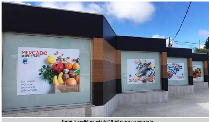
Foram investidos mais de 50 mil euros no mercado

O mercado estará aberto de terça a domingo, das 08h00 às 14h00.