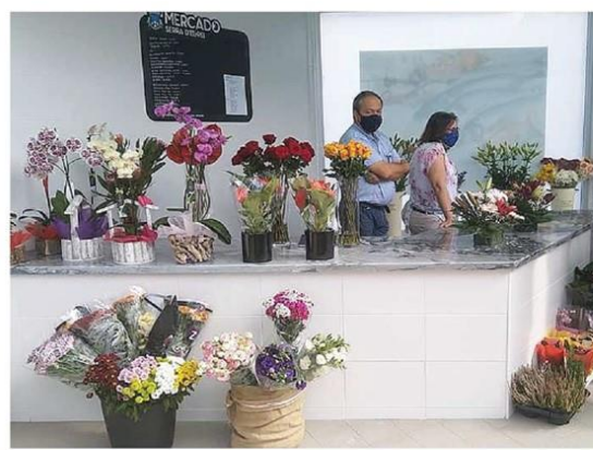
Frutas, legumes e flores